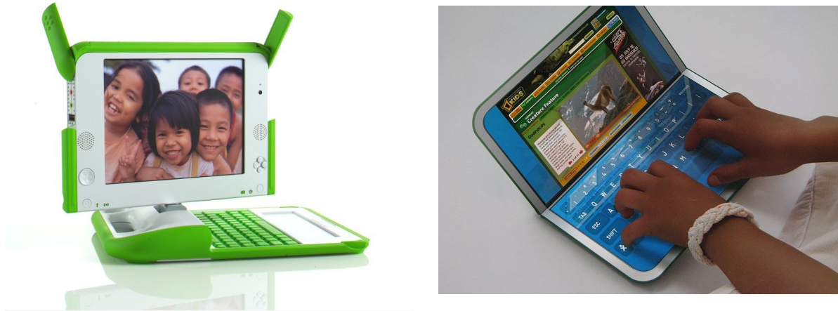
Figure 1 : XO et XO-2

Voici l'ordinateur révolutionnaire qui a permis de vulgariser les recherches du MIT.